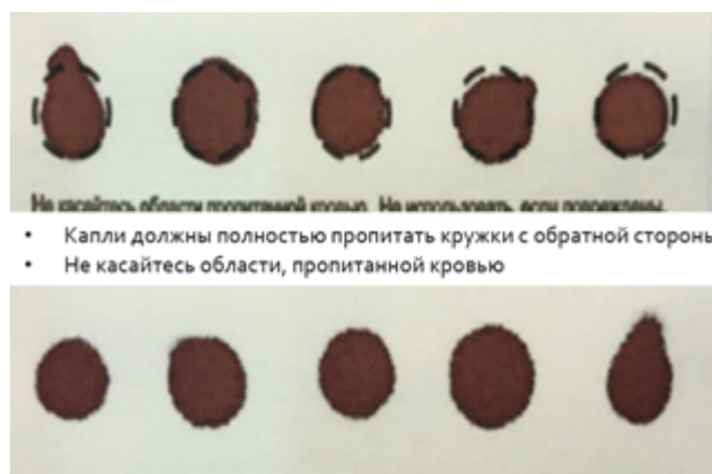
Рисунок 1. Образец правильного нанесения крови на карточку-фильтр

На карточке-фильтре обязательно должны быть четко указаны ФИО, кем и откуда направлен пациент, дата рождения и телефон лечащего врача (рисунок 2). Образец сухого пятна крови вкладывается в чистый конверт, либо в чистый файл. Карточка-фильтр не должна соприкасаться с грязной поверхностью и с образцами других пациентов. Необходимо приложить к образцам информированные согласия пациента или его законных представителей на проведение лабораторных исследований